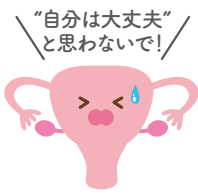
(人口10万人あたり) 子宮頸がんになった人の割合(2015年・全国)※1

子宮頸がんは、他のがんと同じ、20代から増え始め、30代から40代の女性に多いがんです。近年、特に20代から40代で急増しています。